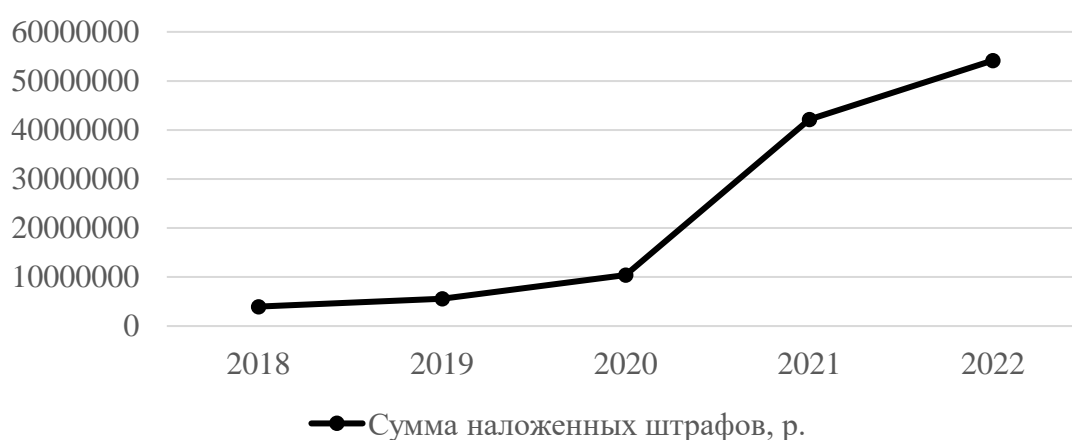
Рис. 3. Динамика сумм наложенных административных штрафов за 2018–2022 гг.

Исходя из расчетов заметно большое увеличение сумм наложенных административных штрафов. За период с 2018 по 2022 гг. сумма штрафов увеличилась на 1 264,2 %, т. е. на 50,1 млн р. Это обусловлено тем, что размер штрафов за нарушения в сфере персональных данных за исследуемый период часто увеличивались.