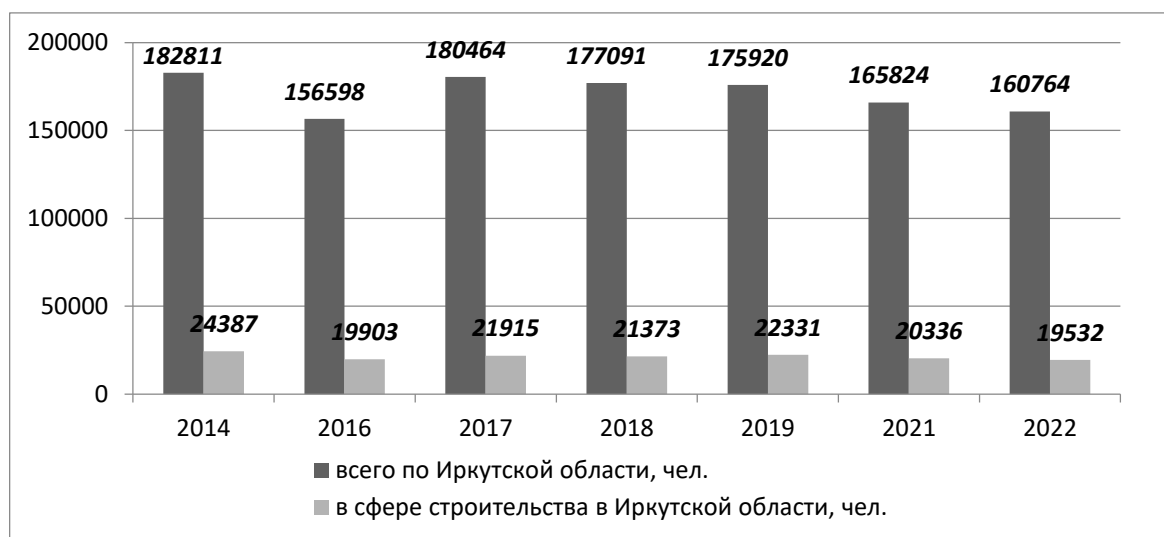
Рис. 1. Динамика средней численности работников в микро- и малых строительных предприятиях в Иркутской области за 2014–2022 гг.

Анализ статистических данных показывает, что среднесписочная численность персонала, занятого в малых и микропредприятиях в строительстве в Иркутской области остается почти на одном уровне, в то время как в целом по России наблюдается некоторое снижение этого показателя (рис. 1, 2) 1 .