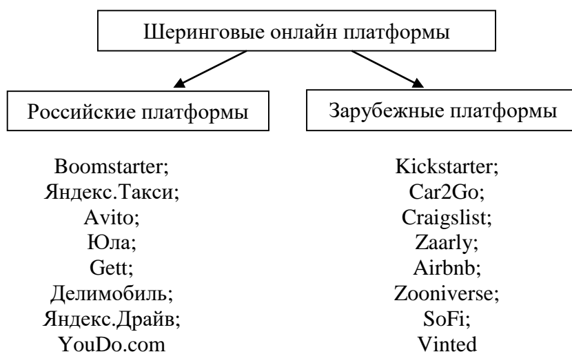
Рис. 2. Примеры шеринговых платформ

Экономика совместного пользования обладает широким ассортиментом различных товаров и услуг, которые размещены на онлайн платформе (рис. 2).