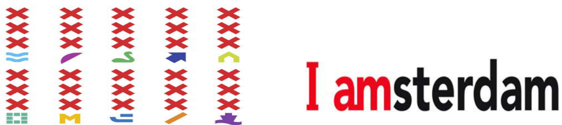
Рис. 1. Логотипы Амстердама: старый и новый

Отказ от традиционных изображений «трех крестов», кстати довольно популярных среди местного населения и бизнеса, стало частью политики по разрыву шаблонного представления об Амстердаме как города вседозволенности. Особенностью нового бренда, выделяющей его из ряда других, является вовсе не конструктивное и графическое решение, а «материализация» в реальной городской среде. По-настоящему логотип «I amsterdam» заработал в качестве объемных скульптур, которые были установлены в городе. Они стали новой достопримечательностью.